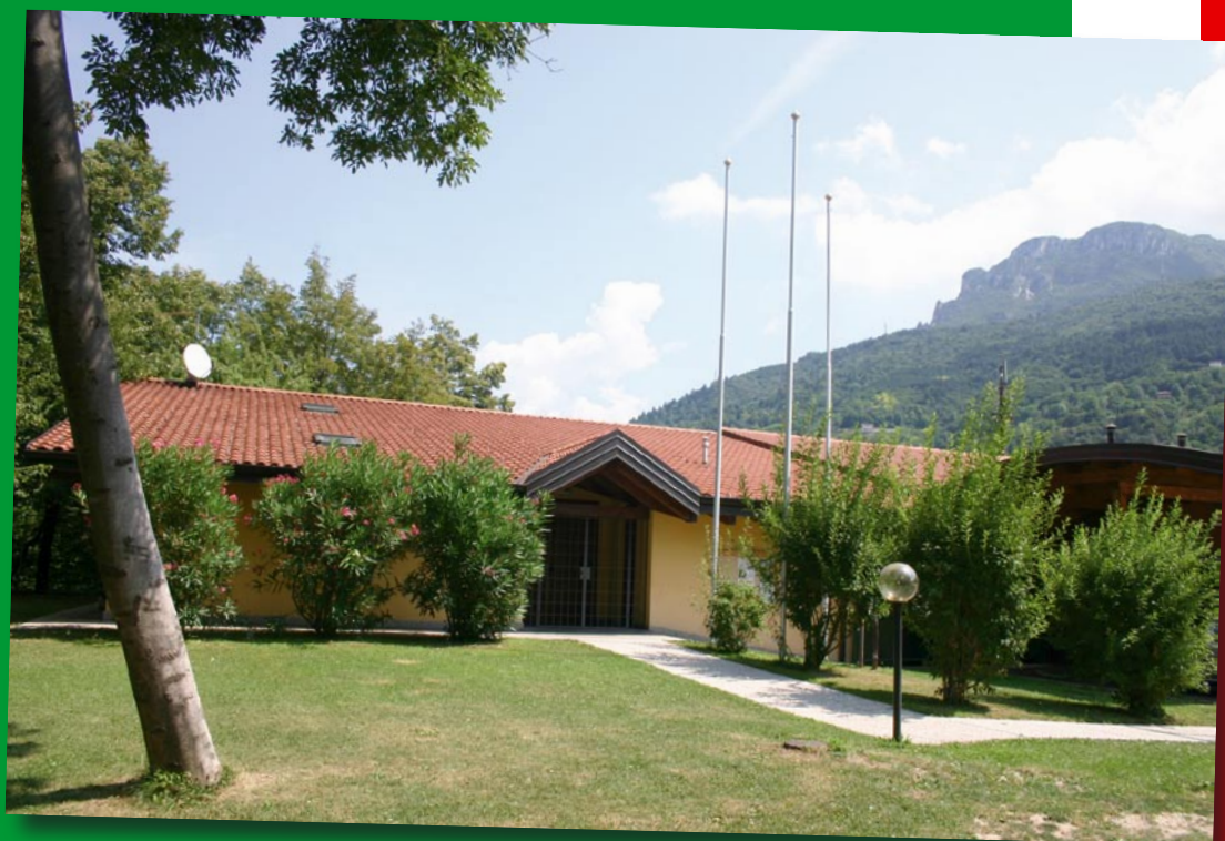
La nostra "baita", all'esterno e all'interno.